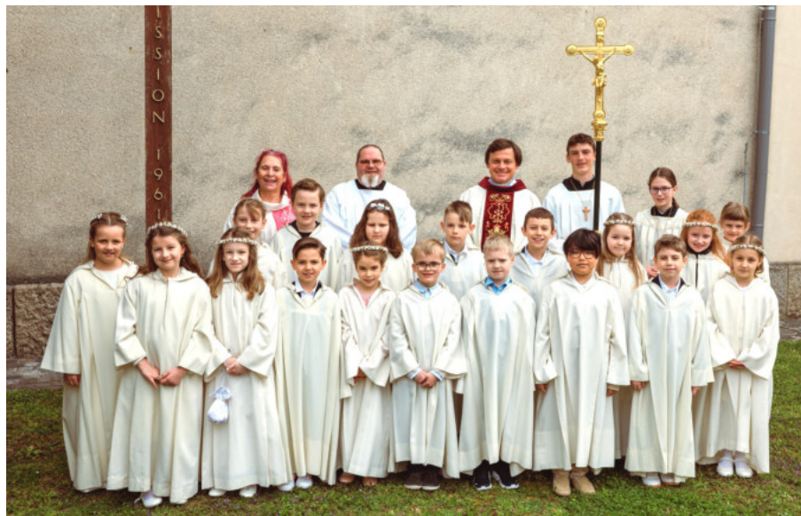
Gruppenbild der Erstkommunionkinder

zehn Kinder in ihren weißen Kutten, ein Symbol für das Taufgewand, unter Glockengeläut zur Kirche gehen, kommen mir die Tränen. Die Feier in der Kirche war sehr schön und dank der Musikgruppe schwungvoll gestaltet. Die anschließende Agape, dank der eifrigen Helferinnen in der Küche liebevoll vorbereitet, lud alle Familien zum Feiern ein.