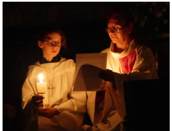
Fragen eines Kindes in der Osternacht 2026