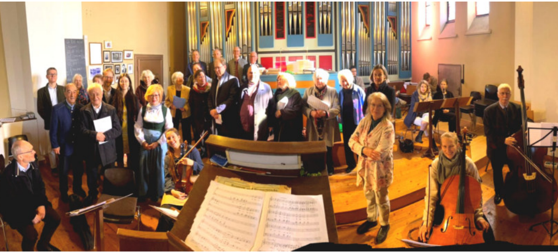
Der Kirchenchor mit Orchester