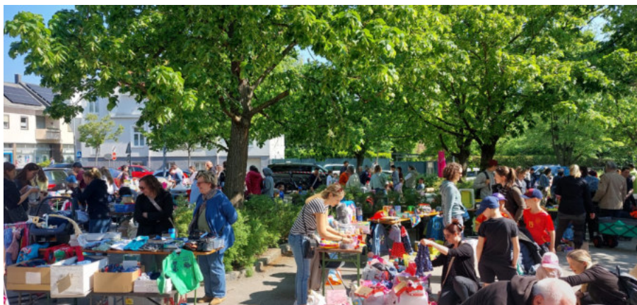
Beim Kindersachenflohmarkt wechselten wieder viele gut erhaltene Gebrauchsgegenstände den Besitzer - ein Plus für die Umwelt!